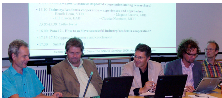
Debatten i full gång

ARTIST2 har sammanlagt sju kluster; modellering och komponenter, hård realtid, adaptiv realtid, kompilatorer och tidsanalys, målplattformar, test och verifiering, och reglerteknik i inbyggda system, med totalt över 130 seniora forskare, och med dessa, tillsammans med de indirekta ansluta, når man upp i en volym av 400 forskare. Detta sätter Sverige på tredje plats i Europa bland deltagande universitet, över oss finner vi Tyskland och Frankrike.